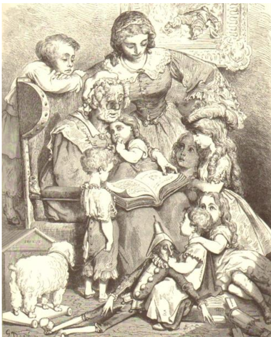
Grootmoeder vertelt sprookjes, een familietafereel door Stéphane Doré.